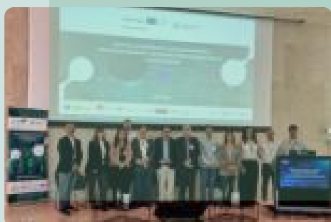
BIOTECNOLOGÍA EN ACCIÓN · Braga

✓ Descubre más sobre un evento IberoBio destinado al fomento de la innovación: