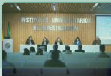
SEMINARIO ONE HEALTH · Cáceres