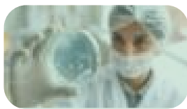
CARACTERÍSTICAS DEL SECTOR BIOTECNOLÓGICO