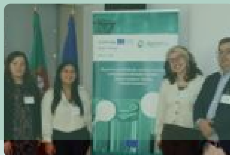
BIOBRUNCH 2.0 · Vila do Conde