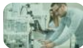
PROPIEDAD INDUSTRIAL Y BIOTECNOLÓGICA