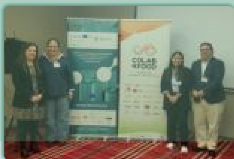
BIOBRUNCH · Porto

✓ Conoce más sobre una de estas sesiones de conexión para la financiación: