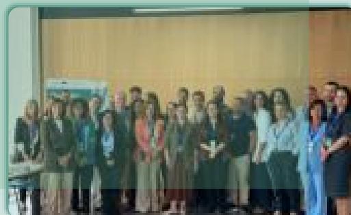
PRESENTACIÓN POLO IBÉRICO TRANSFRONTERIZO · Santiago de Compostela