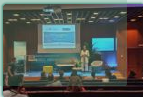
FORO DE FINANCIACIÓN IBEROBIO · Cádiz