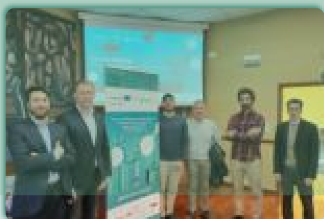
INTERNACIONALIZACIÓN BIOTECH: OPORTUNIDADES DEL VENTURE BUILDING · Santiago de Compostela

✓ Descubre más sobre algunas de las jornadas celebradas por IberoBio: