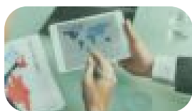
EL PROCESO DE INTERNACIONALIZACIÓN

ESTOS SON ALGUNOS DE NUESTROS CURSOS DISPONIBLES