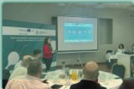
BIO-ALMUERZO IBEROBIO · Salamanca

✓ Descubre más sobre algunos de nuestros eventos: