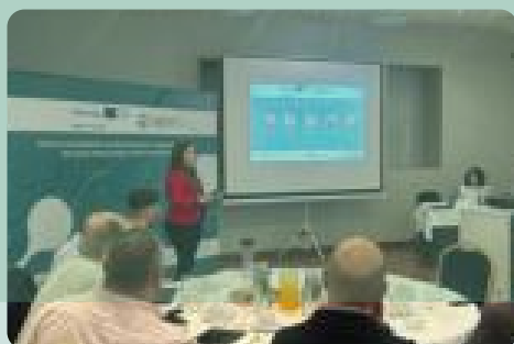
BIO-ALMUERZO "IBERO-BIO" · Salamanca

📍 Descubre más sobre uno de los eventos IberoBio para la promoción exterior: